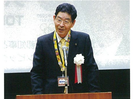
東京都美術館リニューアル開館記念式典（H24.4.16）

東京都美術館の前身、東京府美術館は北九州市若松の実業家・佐藤慶太郎翁から建設費100万円（現在では33億円）の寄附を受け、日本初の公立美術館として大正15年に開館しました。